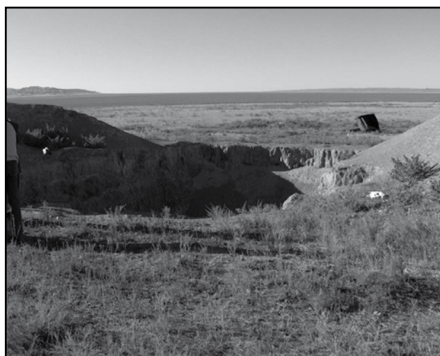
Фото 1 – Яма в Кордайском районе Жамбылской области, куда в 2004 году сбрасывали павших от сибирской язвы овец

Эпизоотическую и эпидемическую опасность представляют места падежа больных сибирской язвой сельскохозяйственных животных. Местные жители зачастую оставляют павших животных в поле или вывозят трупы животных в ямы (фото 1).