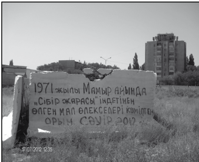
Фото 2 – Сибиреязвенный скотомогильник в г. Таразе

стане отсутствуют санитарные правила и нормы по содержанию сибиреязвенных скотомогильников. Согласно постановлению Правительства Республики Казахстан от 17 января 2012 г. № 93, скотомогильники должны иметь обозначение, располагаться не ближе 2000 метров от населенного пункта.