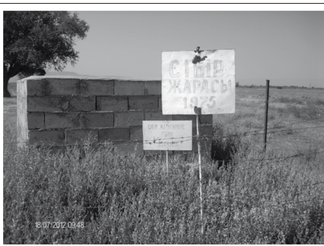
Фото 3 – Сибиреязвенный скотомогильник (Жамбылская область, Жамбылский район, село Кумтыин,