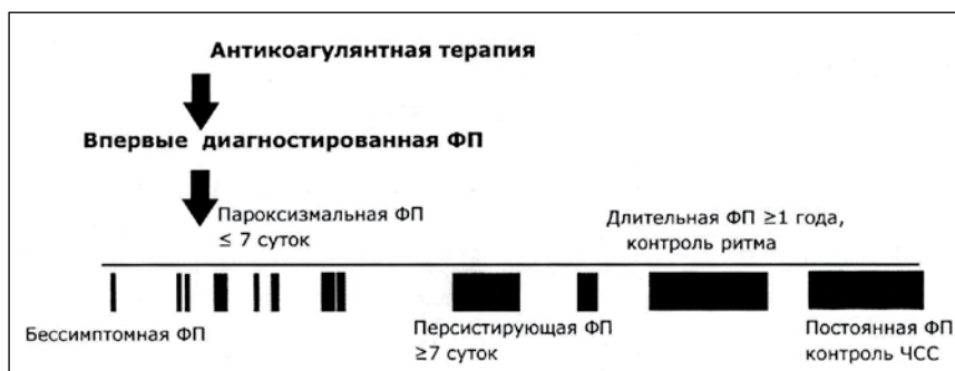
Рисунок 1 – Естественное течение ФП

Эти данные были подтверждены у больных с криптогенным инсультом в результате длительной регистрации ЭКГ с помощью имплантированных до 3 лет устройств. Данные 3-летнего наблюдения ЭКГ с помощью имплантируемых устройств показали, что в 79% случаев ФП в течение 1 года протекает бессимптомно даже в случаях продолжительности эпизода ФП \geq 6 мин. При этом выявляемость ФП через 1 год в группе традиционной диагностики на основании ЭКГ или обычного суточного мониторирования ЭКГ составляла 2%, в то время как в группе длительного мониторирования составляла до 12,4%. К концу 3-го года наблюдения в группе обычной диагностики частота выявляемости ФП составила 3%, в группе длительного мониторирования – 30% [11]. Таким образом, полученные данные свидетельствуют о том, что основной причиной криптогенных инсультов у большинства больных является недиагностированная традиционным методом ФП. Эти данные еще раз подтверждают предположение о том, что